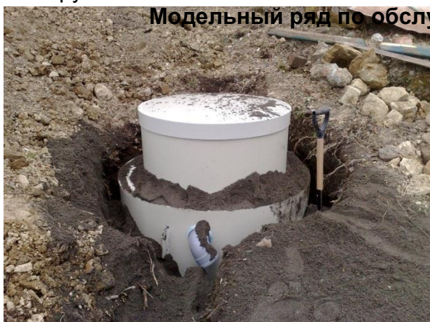
Модельный ряд по обслуживанию человек от 3 до 20

Септики серии «Биосфера» - это полноценные очистные станции, очистка стоков происходит при помощи аэробных бактерий, и системы циркуляции, поднимающих сточные воды через специальную систему распыления, которая циркулирует стоки, насыщая их кислородом (принудительная аэрация), и одновременно питания очищающей биомассы, прикрепленной на искусственных водорослях. Стоки переработанные в ЛОС можно сливать в ручьи, овраги, ливневки. Станция «Биосфера» отличается простотой и надежностью, так как в ней отсутствует сложное компрессорное оборудование, для перемешивания стоков и их циркуляции используется обычный погружной насос.