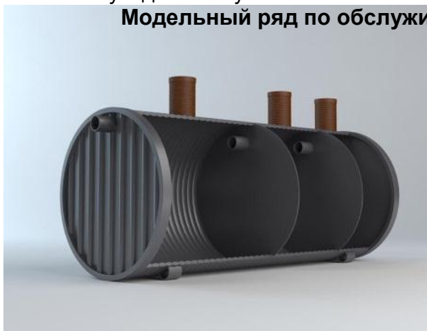
Модельный ряд по обслуживанию человек от 3 до 20

Септики серии «Дрена - БИО» являются энергонезависимыми, то есть не требуют подключения к электричеству, внутри разделены на три камеры (секции), данные станции производят очистку сточных вод, обязательным условием, является удаление стоков на подземные поля фильтрации (фильтрующие траншеи, фильтрующие колодцы), для того чтобы произвести почвенную доочистку стоков.